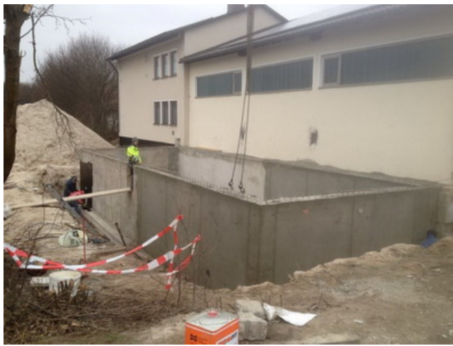
06.04.2013 Grundanstrich angebracht, Wände isoliert und Baugrube verfüllt