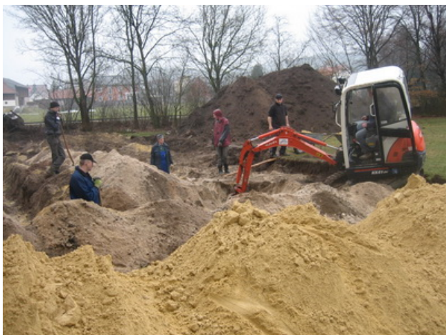
11.03.2013 Alte Gasleitung ausbauen, neue Erdgasleitung verlegen mit Stadtwerke und Fa. Wünschmann. Graben verfüllen.