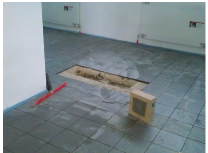
27.07.2013 Montage der Abflussrinnen