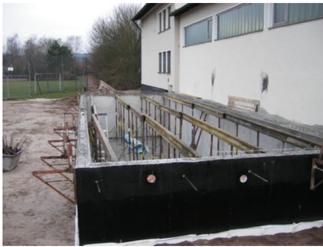
11.04.2013 Verlegen der Fertigdecke, einschalen der Kellerdecke und einbringen der Armierungseisen