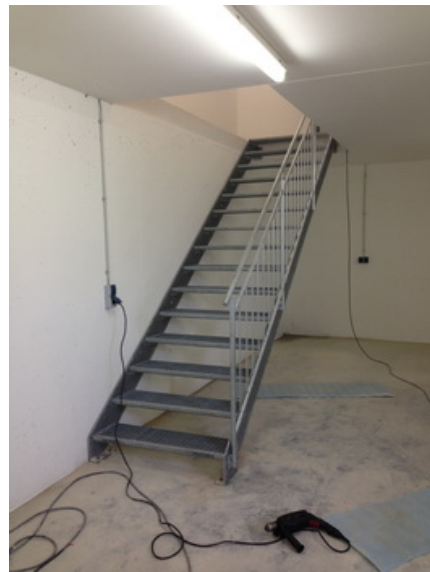
19.07.2013 Streichen der Decke 20.07.2013 Streichen der Decke, Fußboden für die Fliesen vorbereitet 22.-25.07.2013 Legen der Fliesen