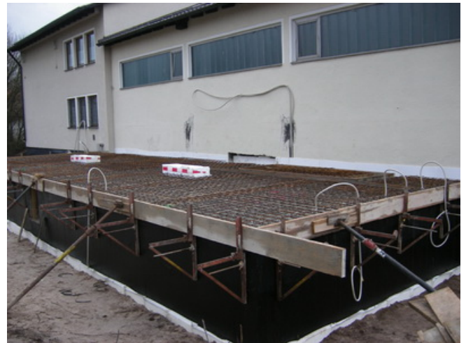
12.04.2013 Betonieren der Kellerdecke 13.04.2013 Ausschalen der Kellerdecke 15.04.2013 Mauern der Außenwände