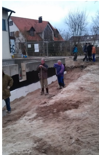
10.04.2013 Aufstellen der Baustützen